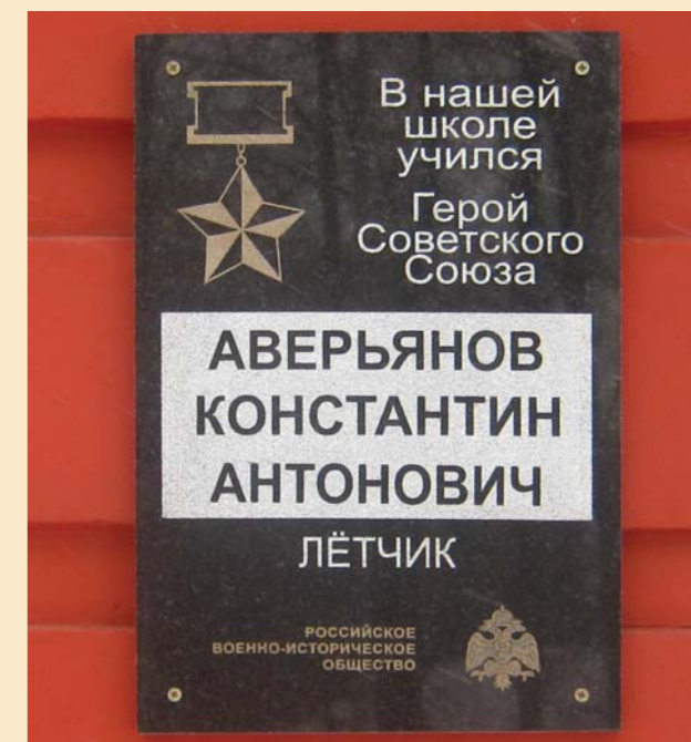
Мемориальная доска, установленная на входе в среднюю школу № 5 имени Константина Аверьянова в Дмитрове