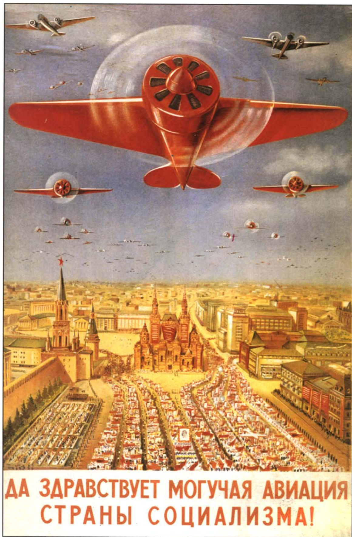
Репродукция плаката В. Добровольского. 1939 г.