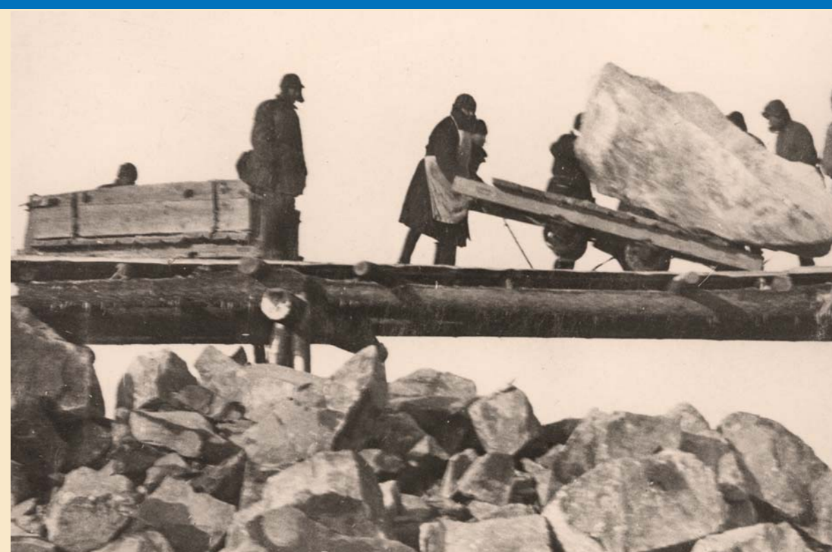
На строительстве канала Москва-Волга. Фото тех лет.