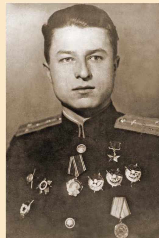
Герой Советского Союза гвардии старший лейтенант Аверьянов после вручения медали Золотая звезда и ордена Ленина, Москва, ноябрь 1944 г.

ствовать. Обе четверки развернулись и легли на обратный курс. Однако в полк Костя не вернулся. Неужели погиб?