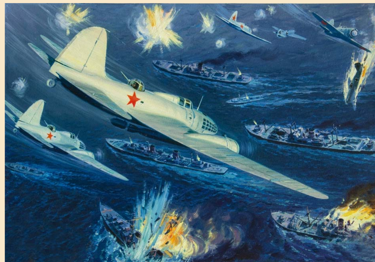
Воздушный бой над морем. Репродукция с картины П.Т. Мальцева