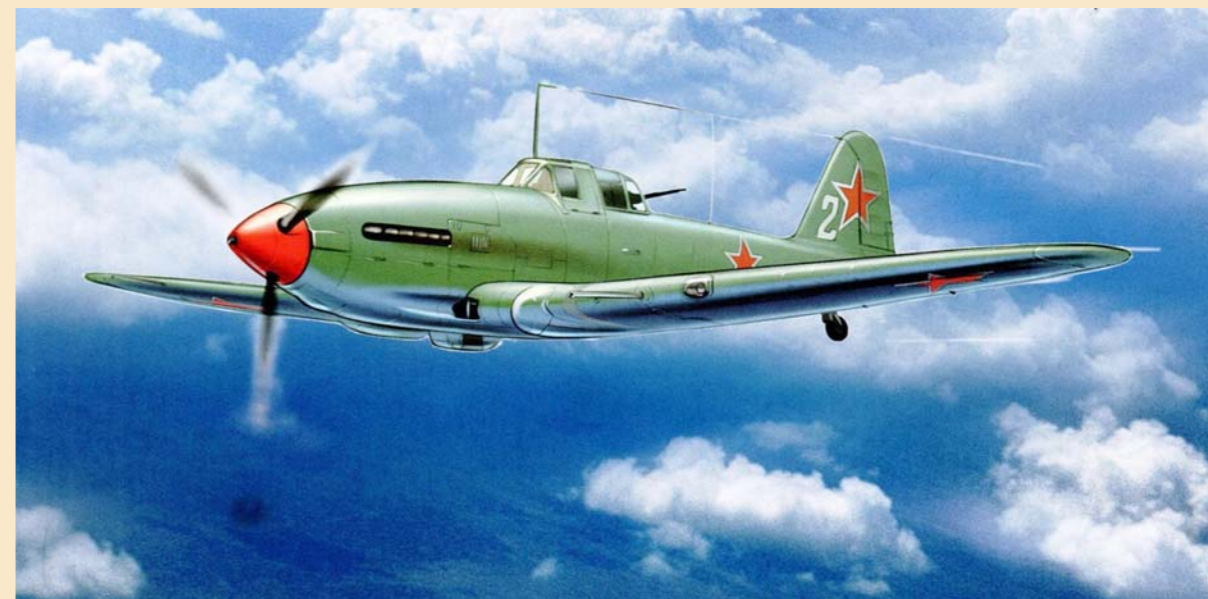
Бронированный штурмовик Ил-10. Художник А. Жирнов.

- А мне тут все телефоны оборвали! Ты представляешь, что сейчас там