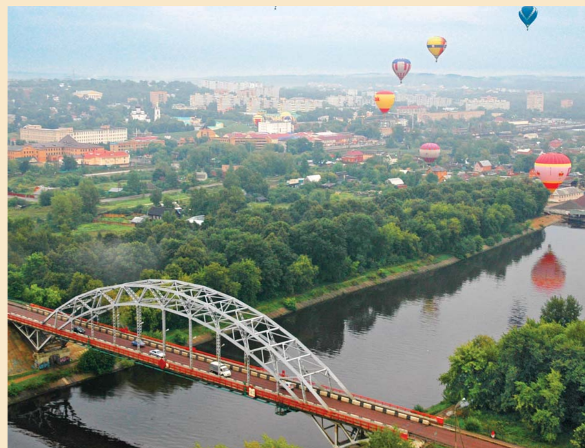
Панорама города Дмитрова и канала Москва-Волга